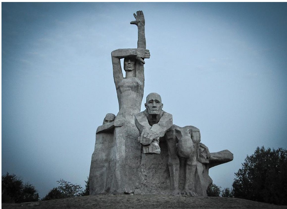
Мемориал «Змиевская балка». Ростов-на-Дону, Россия

Книга написана талантливо, страстно, кровью сердца.